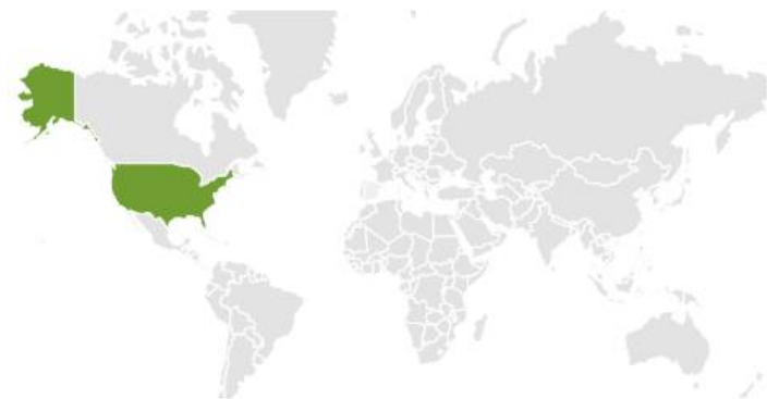
UCAP LN Equity